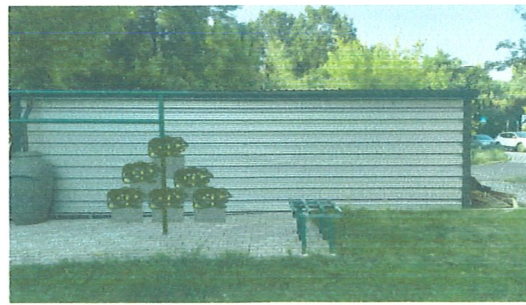
Południowa strona po obsadzeniu