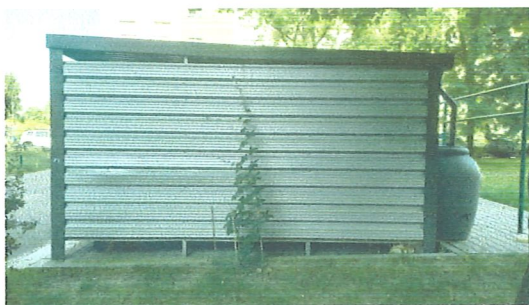
Zachodnia strona obecnie

Obie części pomysłu niech zwizualizują poniższe szkice: