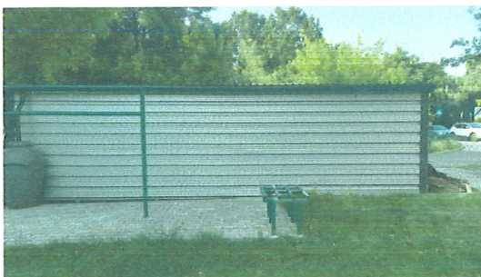
Południowa strona obecnie