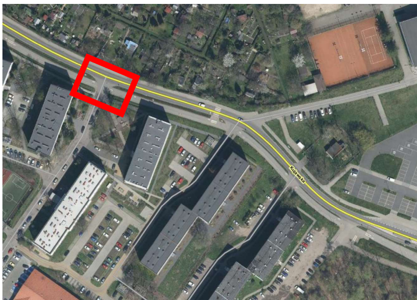
Rysunek 2 Przejazdy DDR Wariant 2 - alternatywny

Wariant 2 przedstawiony jest jako wariant alternatywny do wariantu 1, gdyby wariant 1 nadal nie spełniał wymagań finansowego. Wariant ten zakłada przebudowę jednego miejsca krzyżowania się DDR z drogą wewnętrzną, zgodnie z wymaganiami opisanymi w projekcie oryginalnym. Miejsce to zaznaczone jest na zdjęciu poniżej.