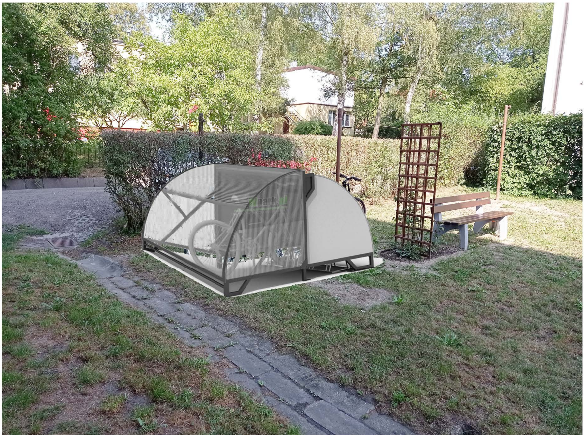
Proponowana lokalizacja wiaty - wizualizacja poglądowa